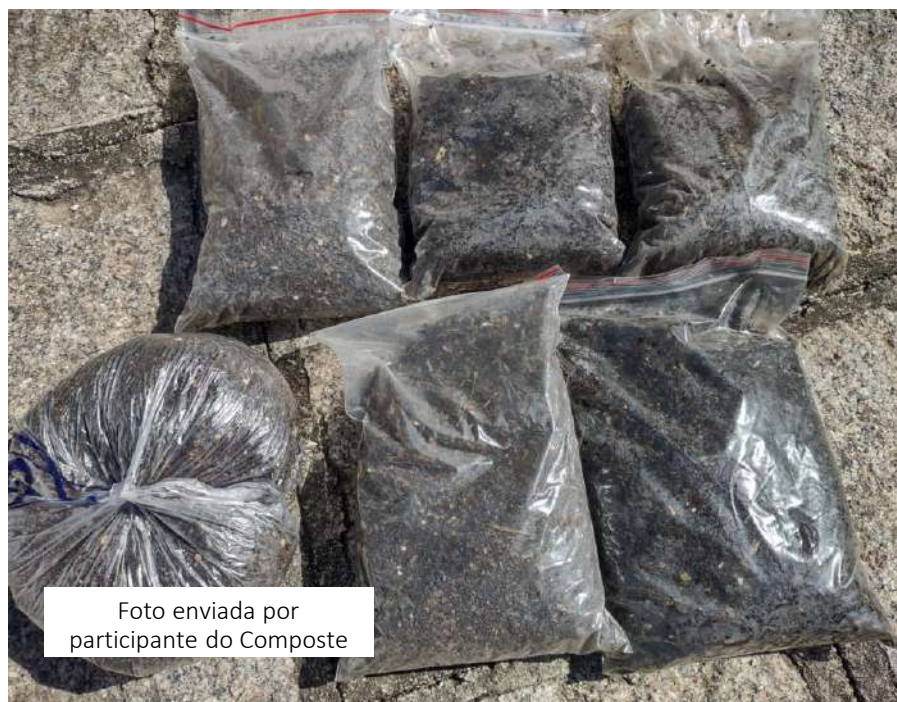
Foto enviada por participante do Composte