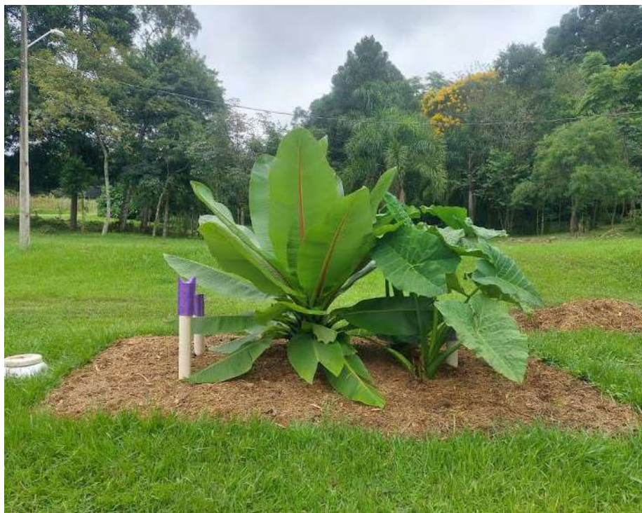
Sistema de tratamento para o excedente de chorume