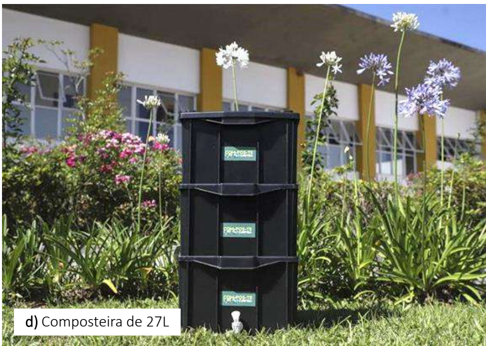
d) Composteira de 27L