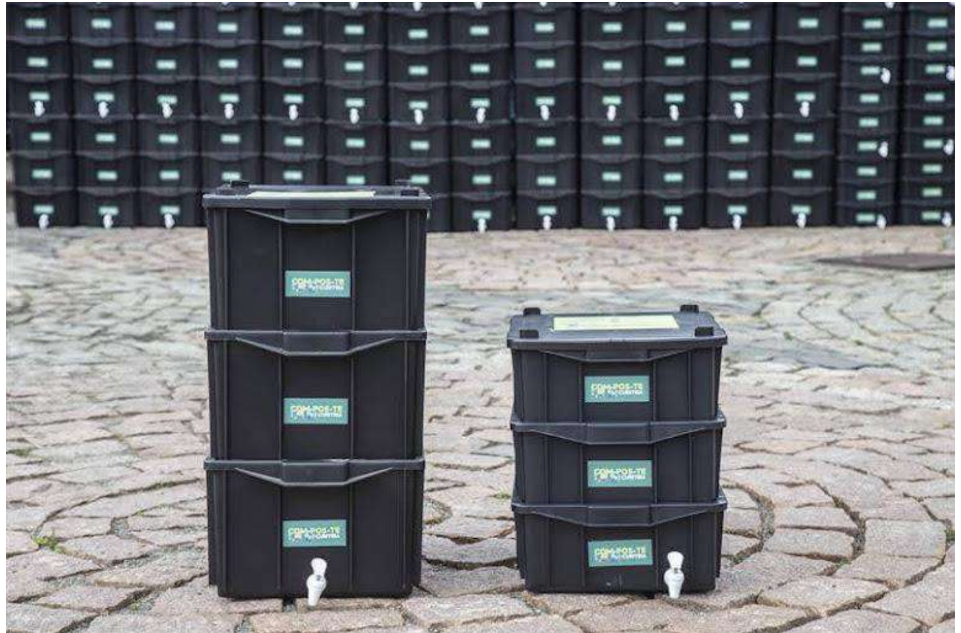
Composteira de 26 L e Composteira de 15L