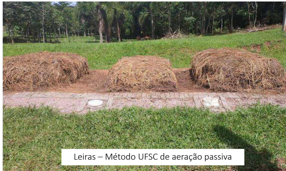
Leiras – Método UFSC de aeração passiva