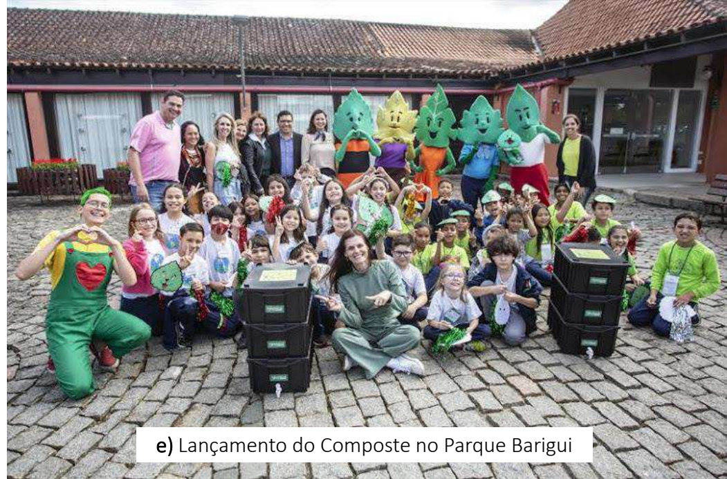
e) Lançamento do Composte no Parque Barigui