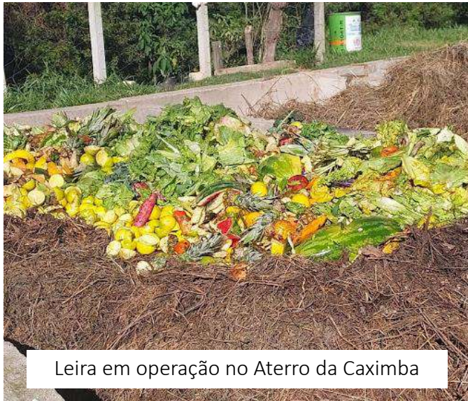
Leira em operação no Aterro da Caximba