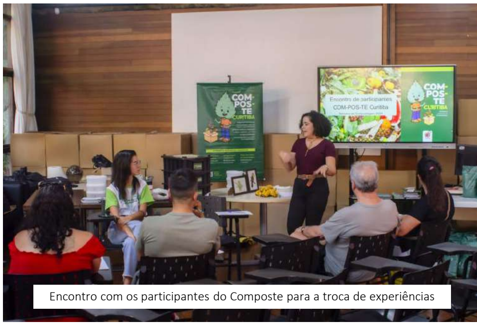
Encontro com os participantes do Composte para a troca de experiências