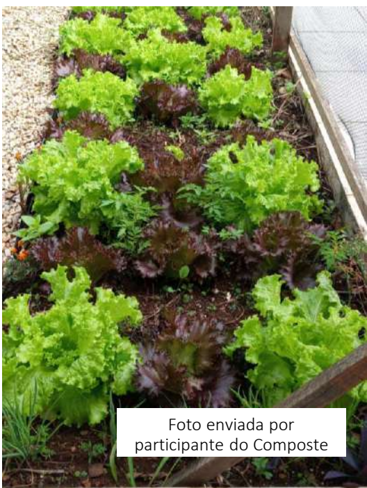
Foto enviada por participante do Composte