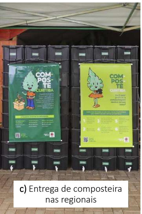
c) Entrega de composteira nas regionais