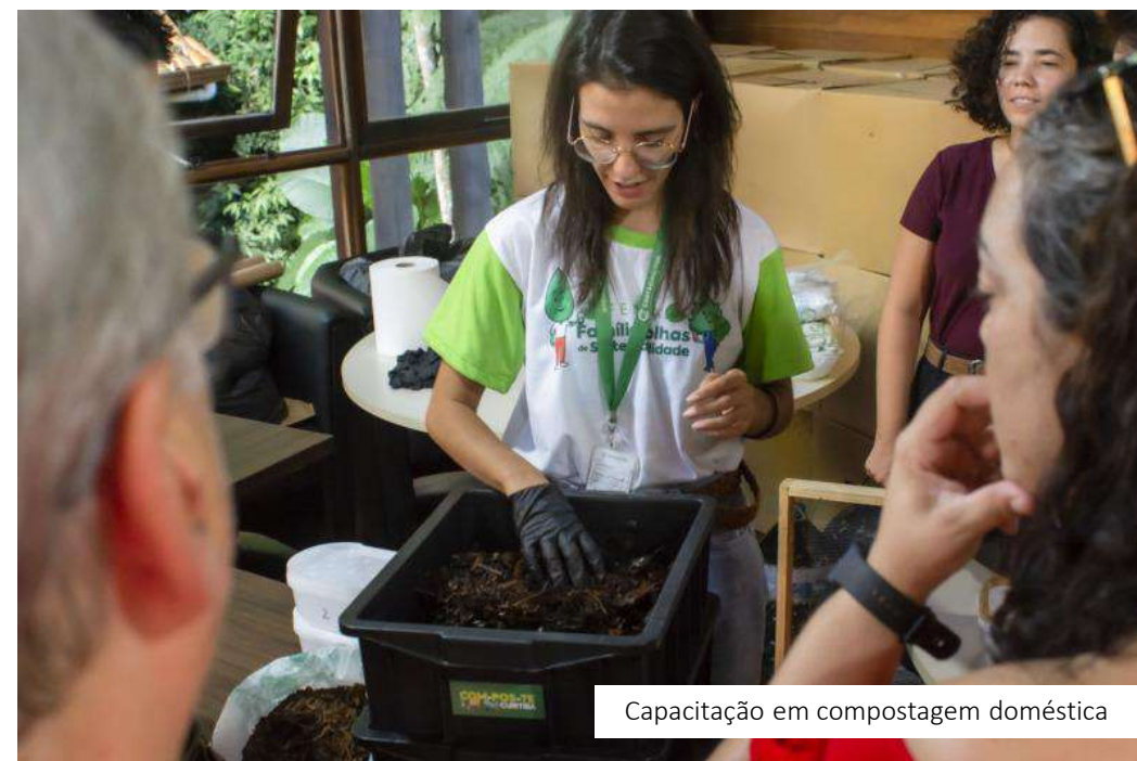
Capacitação em compostagem doméstica