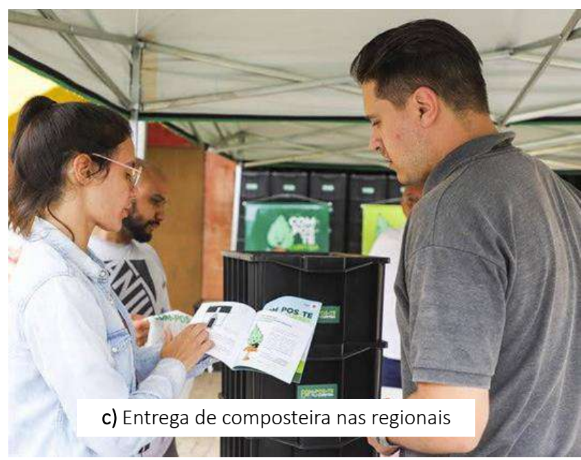
c) Entrega de composteira nas regionais