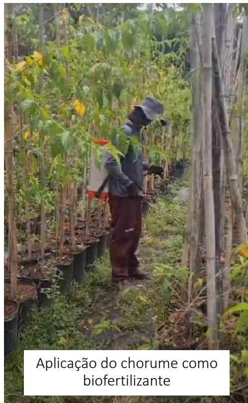
Aplicação do chorume como biofertilizante