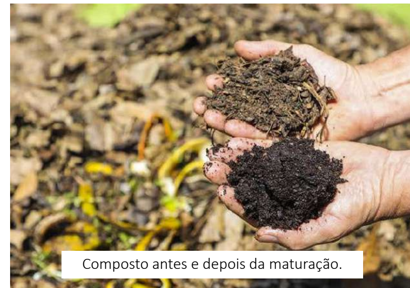
Composto antes e depois da maturação.