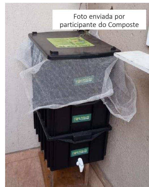
Foto enviada por participante do Composte