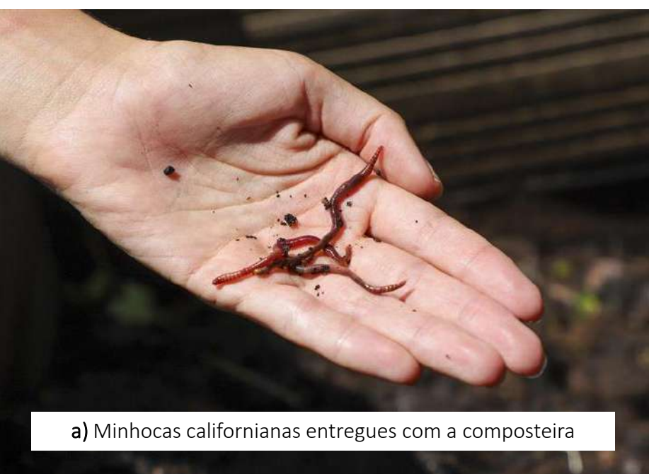
a) Minhocas californianas entregues com a composteira