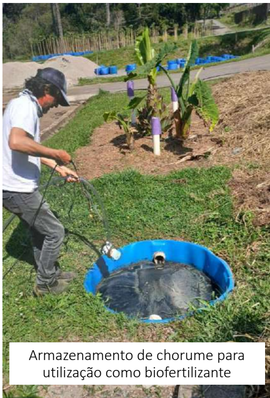
Armazenamento de chorume para utilização como biofertilizante