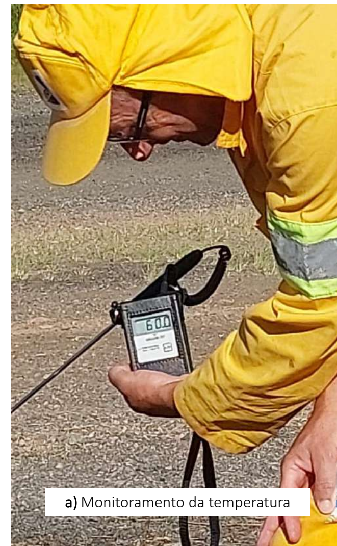
a) Monitoramento da temperatura