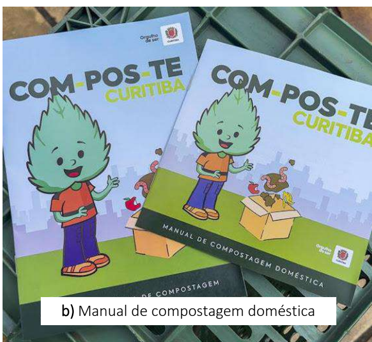
b) Manual de compostagem doméstica