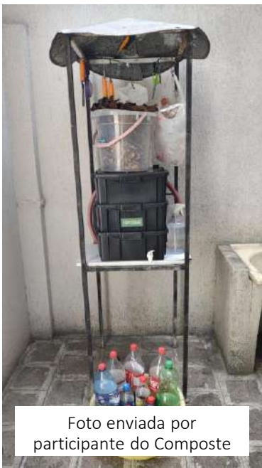
Foto enviada por participante do Composte