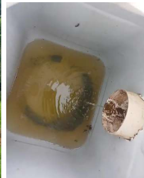
Excedente do chorume pós tratamento